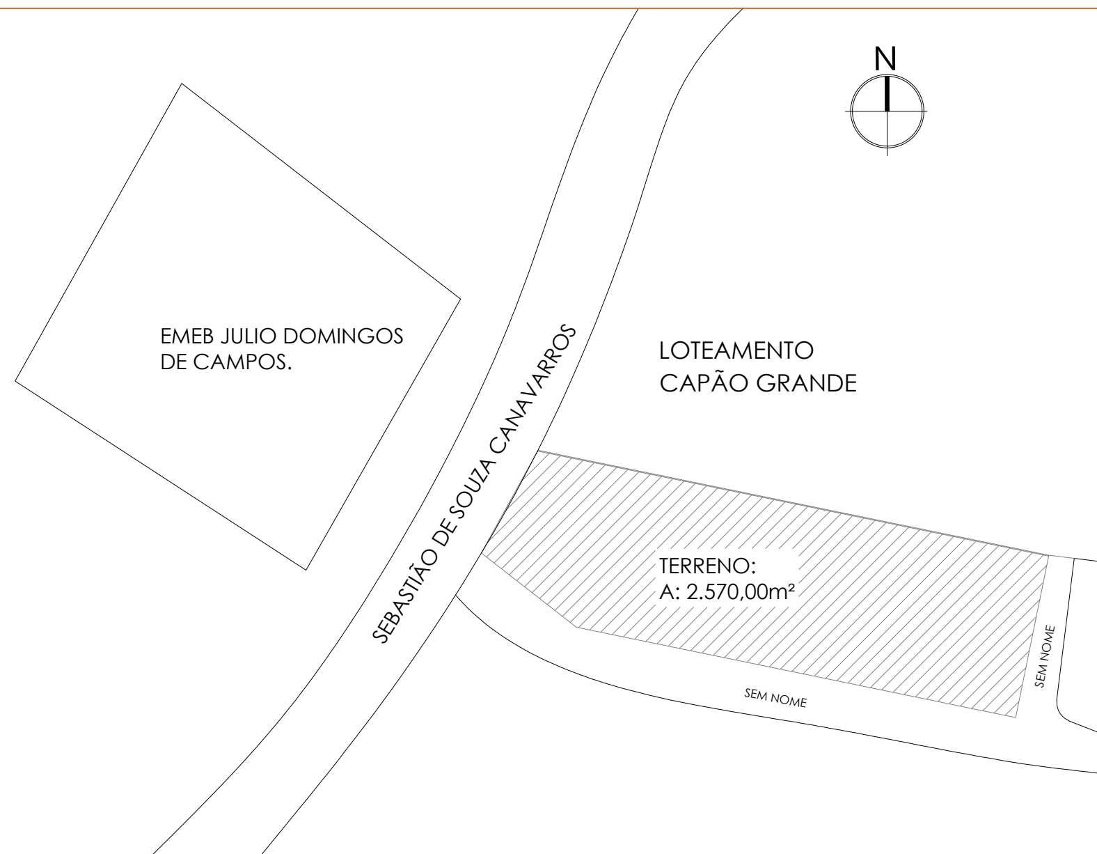
PLANTA DE SITUAÇÃO ESC: 1/1000